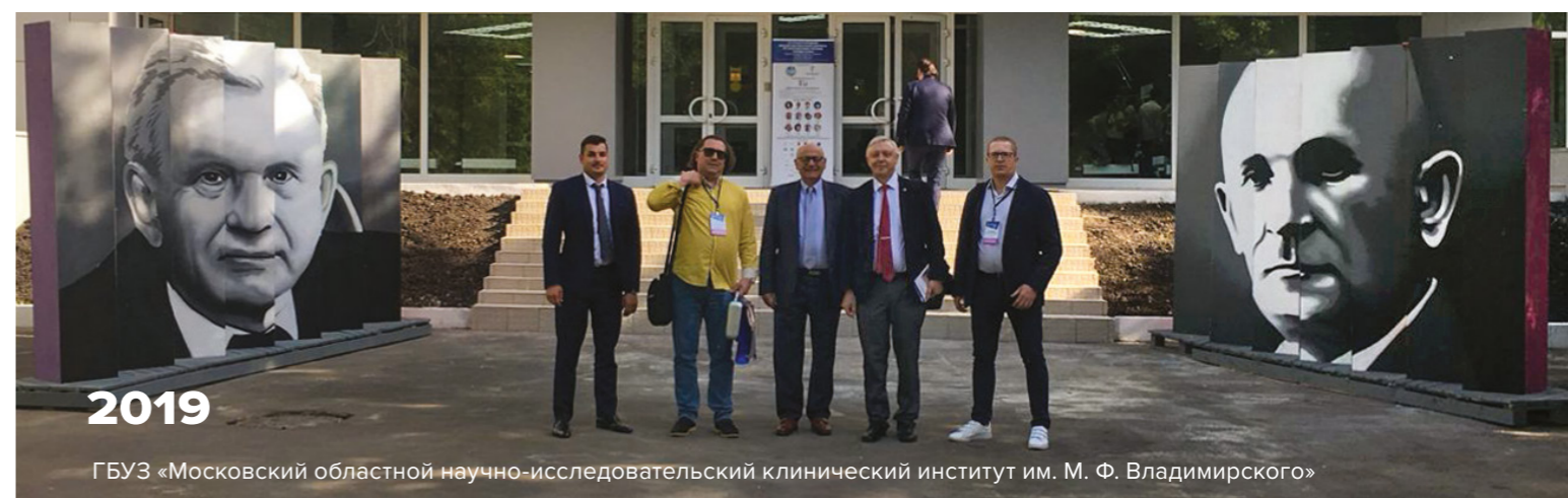
ГБУЗ «Московский областной научно-исследовательский клинический институт им. М. Ф. Владимирского»